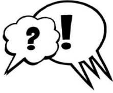
UNTERSTÜTZUNG UND AUSTAUSCH

Verschiedene Online- und Offline-Aktionen, die zum Denken, Fragen, Weiterdenken anregen. Dazu gehören auch unsere 3 Podcasts, die wir bereits produziert haben.