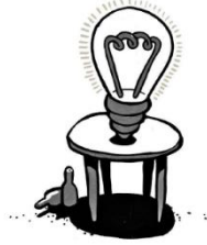
VERWIRKLICHUNG VON IDEEN & PROJEKTEN