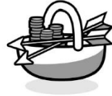
TAUSCH VON DIENSTLEISTUNGEN