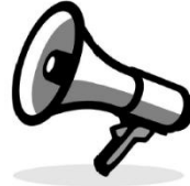
EINE GEMEINSAME STIMME